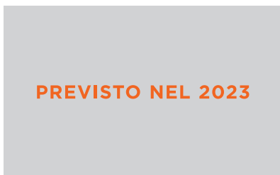
Raccogliatore d'uva, sistema per la raccolta dei grappoli