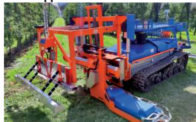
Trincino interceppo per la trinciatura dei tralci ed il taglio dell'erba intorno ai ceppi