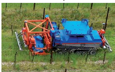
Tosaerba per tagliare l'erba nell'interfilare ed in capezzagna