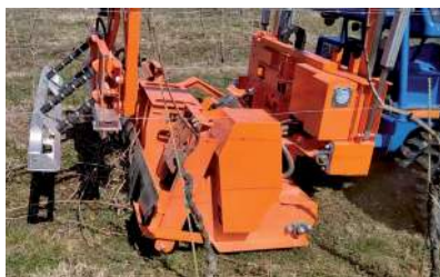
Trinciasarmenti per sminuzzare rami lignificati, erba e fiori