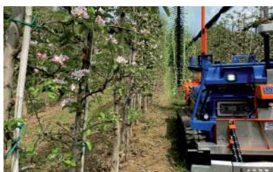
Diradatore meccanico, sistema per il controllo dell'alternanza su alberi da frutto