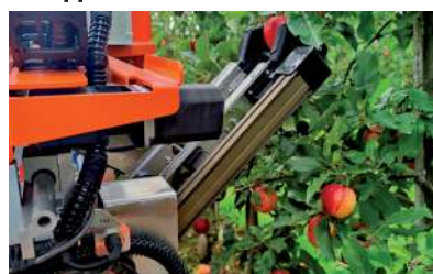
Raccogliatore di mele, sistema di raccolta della frutta che imita i movimenti umani