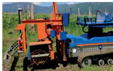
Tosapollonatrice laterale, sistema di pulizia e spollonatura attorno e sui ceppi