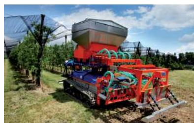
Spargiconcime, sistema di distribuzione del concime