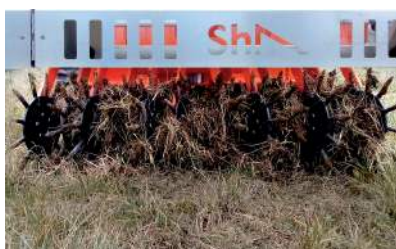
Sarchiatrice a dita rotativa, sistema di dissodamento leggero del cotico erboso e del terreno