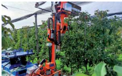
Cimatrice con top orizzontale, per una completa potatura dei tralci