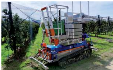
Sistema di raccolta con ripiani mobili regolabili, caricatore frontale e muletto di scarico per i cesti