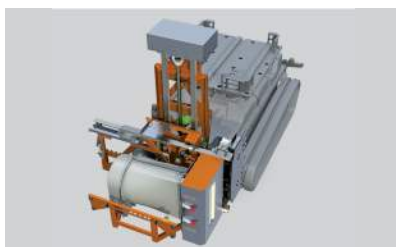
Defogliatrice sistema per rimuovere le foglie in zona grappolo o frutto