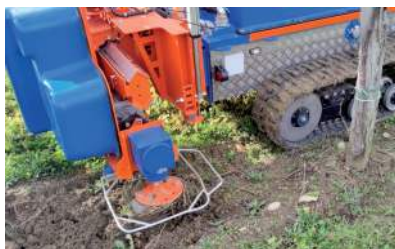
Erpice rotante interceppo, sistema di coltivazione tra le piante