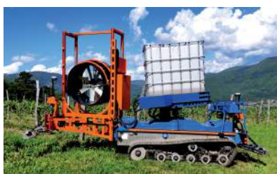
Atomizzatore funzionante anche in condizioni di vento sostenuto con irradiazione uniforme